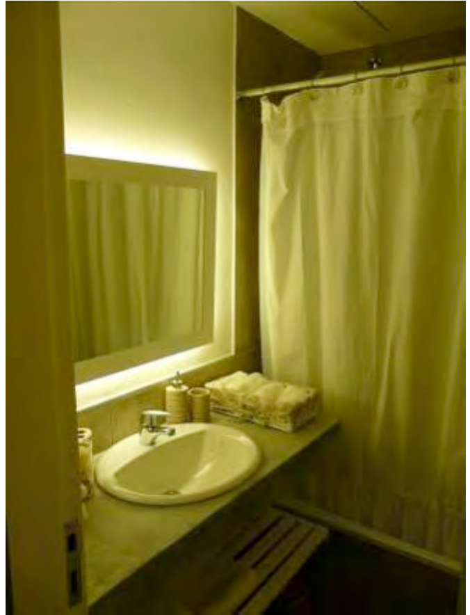
VISTA GENERAL SECTORES A Y B