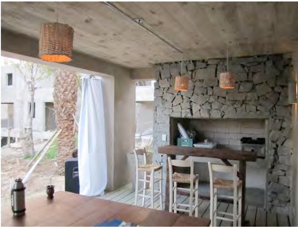
UNIDAD MODELO (UF 17): VISTA DESDE LA GALERIA HACIA LA PARRILLA Y HACIA EL LIVING-COMEDOR