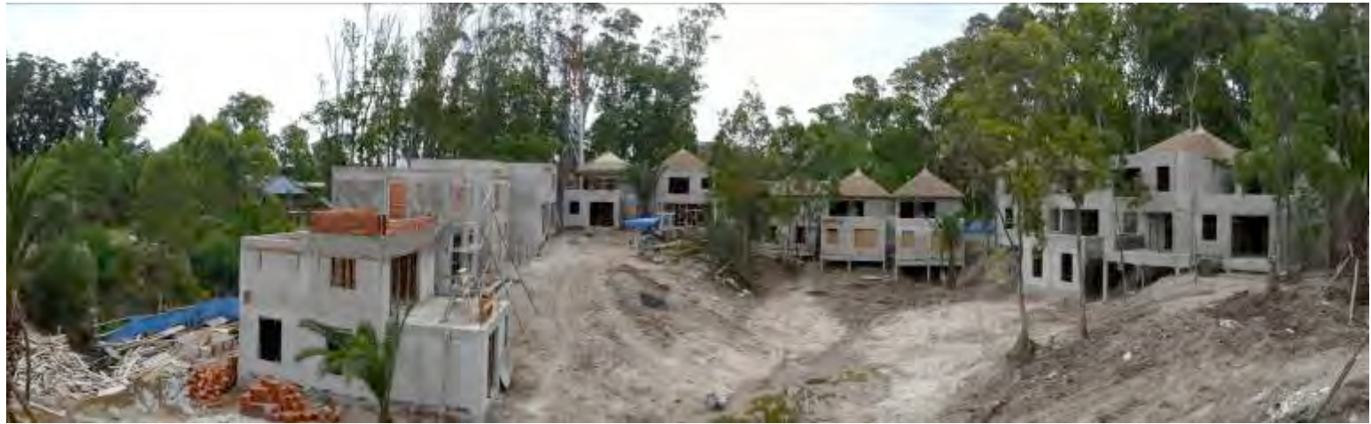
VISTAS GENERALES DE AMBOS SECTORES.